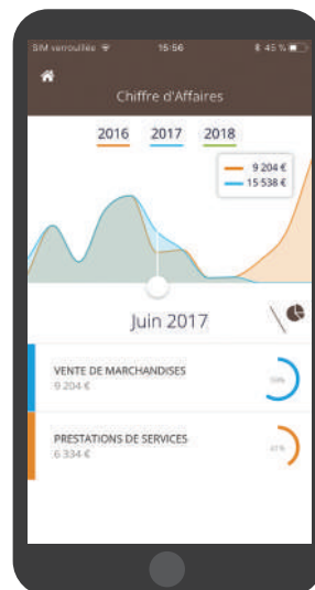
Aperçu en version mobile